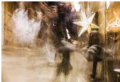
Imatge: 'Nadal al carrer Banys Vells 2014'